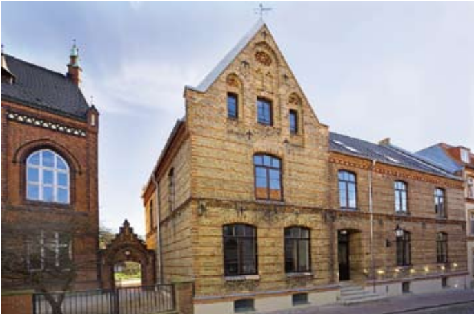
Straßenfassade nach der Sanierung

Bereits im „Stadtkern“, Ausgabe Juni 2007, wurde über das Rektorenhaus und dessen Sanierung berichtet. Dieser Artikel soll an das bereits Beschriebene anknüpfen.