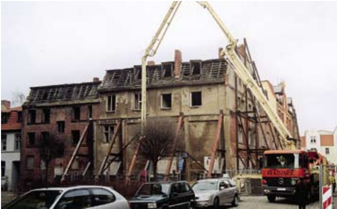
Beginn der Sicherungsarbeiten 2002

Hinter dem Chor der Nikolaikirche, wo seit einigen Wochen die Stahl- und Baugerüste gefallen sind, ist wieder Leben hinter historischen Mauern eingekehrt. Die derzeitigen 18 Bewohner teilen sich die acht in den beiden Giebelhäusern Hinter dem Chor 2 und 4 sowie im dritten Gebäude St.-Nikolai-Kirchhof 19 ein- bzw. umgebauten 1- bis 3-Raum-Wohnungen.