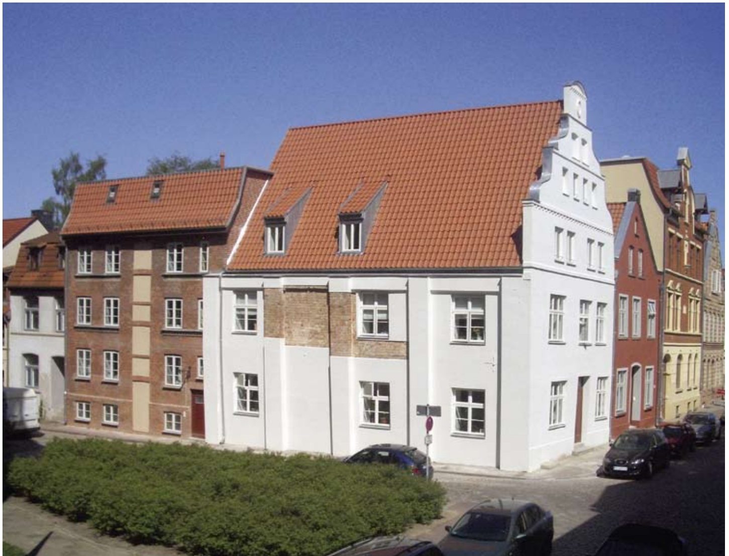
Hinter dem Chor 2 und 4, St.-Nikolai-Kirchhof 19, Ansicht von Südost nach der Sanierung