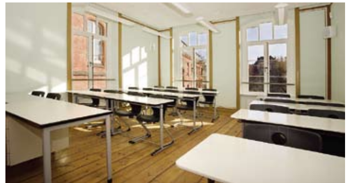
In den Musikräumen im Obergeschoss wurde nach erforderlicher Deckenbalkensanierung und -verstärkung der originale Dielenboden wieder eingebaut. An den Wänden wurde die originale Farbgebung aus der Erbauungszeit rekonstruiert.