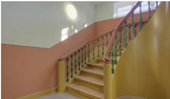
Die originale Treppe vom Erdgeschoss zum Obergeschoss und die Treppenhauswände haben die historische Farbigkeit wieder erhalten.

Während der Bauphase traten Probleme zu Tage, wie die Belastung des Dachstuhles mit Hausschwamm und Holzschutzmitteln. Die Sanierung dieser Schädigungen wurde von Fachleuten geleitet. Am Anfang der Baudurchführung wurde vom Statiker die Tragfähigkeit von Innenwänden in Frage gestellt. Demzufolge mussten tragende Innenwände zum Teil erneuert werden. Bei der Sanierung der backsteinsichtigen Fassaden wurde eine schonende Reinigung mit Heißdampf vorgenommen, einzelne zerstörte Steine ausgewechselt