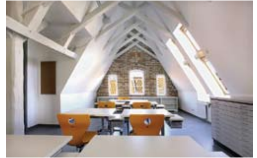
In der frühen Planungsphase im Jahr 2002 wurde beschlossen, das Dachgeschoss auszubauen. Hier befinden sich zwei Kunsträume.