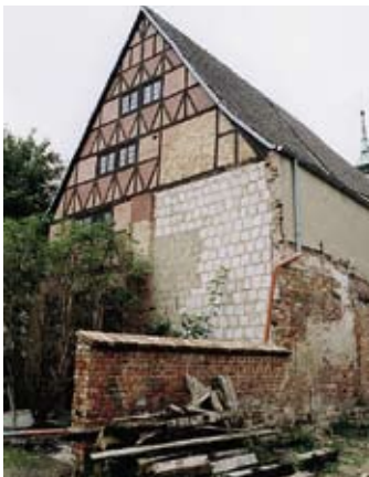
Südliche Hoffassade vor der Sanierung

Das Vorderhaus der Lübschen Straße 44, gegenüber der Heiligen-Geist-Kirche, wurde laut dendrochronologischer Untersuchungsergebnisse in den 1650er-Jahren als Dielenhaus mit Speichergeschossen und vermutlich auch mit Kemladen errichtet. Die Brandwände und ein Kreuzgratgewölbe des Kellers stammen aus früherer Zeit. Ein seitlicher, westlicher Anbau wurde nachträglich in die Nutzung integriert. Grundsätzliche funktionelle und gestalterische Veränderungen lassen sich für das späte 18./frühe 19. Jahrhundert belegen. Sie prägen bis heute das äußere Erscheinungsbild der Straßenfassade, die überlieferte Diele im Erdgeschoss und den zweigeschossigen Durchbau mit Beletage. In den 1980er-Jahren sollte das leer stehende, auffällige Gebäude gemeinsam mit den östlichen Nachbarhäusern zu einem Medizinhistorischen Museum umgestaltet werden. Aufgrund der damaligen bauwirtschaftlichen Verhältnisse konnten die dringend notwendigen konstruktiven Sicherungsmaßnahmen jedoch nicht denkmal- und materialgerecht umgesetzt und die erarbeitete denkmalpflegerische Zielstellung nicht erfüllt werden. Fast alle überlieferten Ausstattungsteile wurden entfernt, die hofseitige Fassade des Vorderhauses mit den verfügbaren Mitteln der DDR rekonstruiert und der desolate hofseitige Kemladen und weitere Nebengebäude abgetragen. Der in diesem Zusammenhang in Angriff genommene Innenausbau des Hauses wurde nicht mehr fertig gestellt. Das Objekt ist seit ca. 20 Jahren ohne Nutzung.