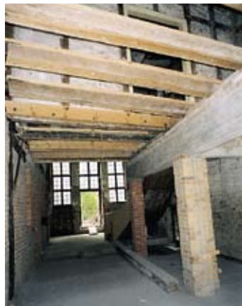
Erdgeschoss, Blick von Nord nach Süd

Erfreulicherweise hat sich nun ein Bauherr gefunden, der diesen mächtigen Baukörper wieder mit Leben erfüllen wird. Der gemeinnützige Verein „Das Boot“ Wismar e.V. baut die Lübsche Straße 44 zu einer weiteren Begegnungsstätte mit Beschäftigungs-, Verwaltungs-, Lager- und Sanitärräumen aus.