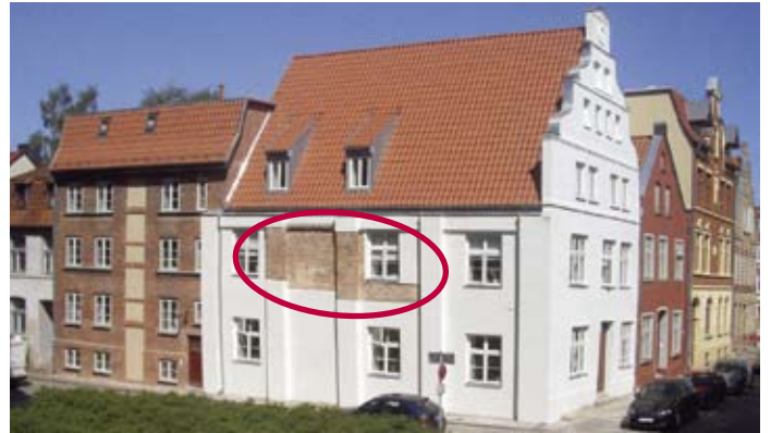
Sichtbares historisches Mauerwerk aus dem Mittelalter mit originalem Fugenstrich

symbolisch für den Verfall der historischen Bebauung in der Altstadt. Da im Sanierungsschwerpunkt Nördliche Altstadt gelegen (Bebauung um und nördlich der Grube), bestand Hoffnung auf eine schnelle Sanierung. 1992 und 1993 wurden für die Gebäude Modernisierungsgutachten für eine zeitgemäße Wohnnutzung erarbeitet, ein möglicher Bauherr war 1994 gefunden. Dieser versprach eine zügige Sanierung des Eckgrundstücks, jedoch waren seine Vorstellungen zum Umbau und zur Nutzung als Hotel auch nach dem Erwerb des Nachbargrundstücks Hinter dem Chor 4 am Standort nicht realisierbar. Da Fortschritte in der weiteren Vorbereitung nicht erwirkt werden konnten, verschlechterte sich der Zustand der Gebäude