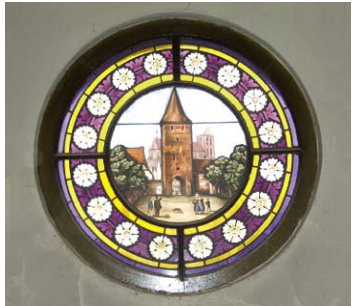
Ornamentfenster als Innenansicht

Das Haus Bahnhofstraße 2 ist ein Gebäude, das zu Beginn des 20. Jahrhunderts errichtet worden ist.