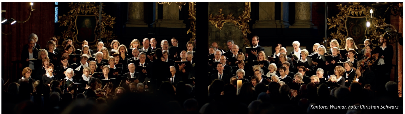
Kantorei Wismar

Karten sind in zwei Kategorien erhältlich: Kategorie A kostet 35,00 Euro, ermäßigt 30,00 Euro. Kategorie B kostet 20,00 Euro, ermäßigt 15,00 Euro. Karten sind in der Buchhandlung Peplau in Wismar sowie per E-Mail an andrea.lehmann@elkm.de erhältlich.