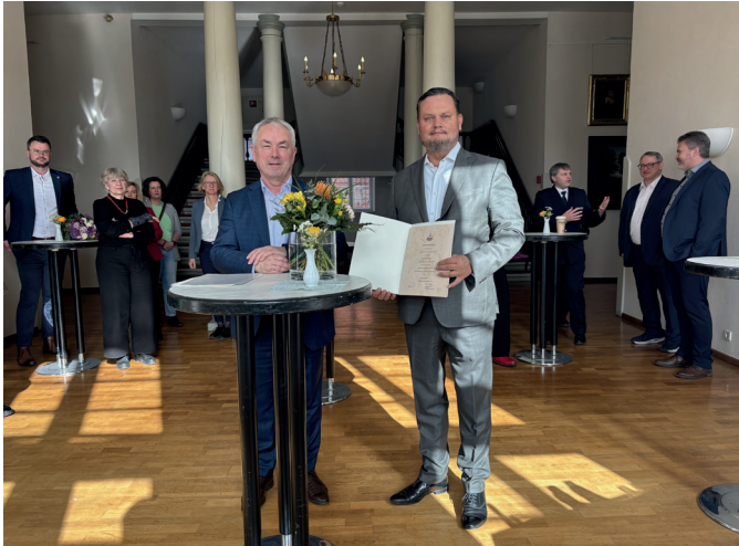
Foto: Thomas Beyer und René Domke

Bürgermeister Thomas Beyer übergab René Domke die Ernennungsurkunde im Rathaus.