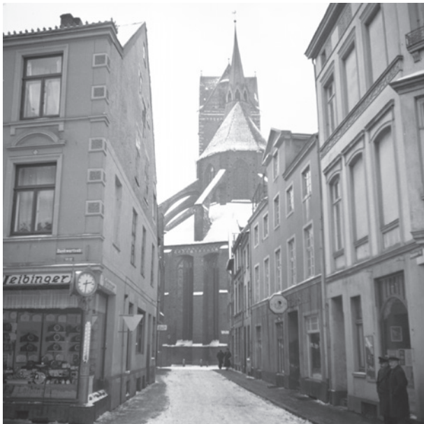
Fotosammlung B.28 2168 – Sargmacherstraße

1291 wurde die Straße als „Straße zur Kirche der Heiligen Jungfrau“ beschrieben, etwas später als „Platz, über den man vom Brotmarkt zur Kirche der Heiligen Jungfrau Maria geht“ (1316). Der Name Sargmacher ist seit 1367 überliefert und bezieht sich auf die Sargtischler, die auf dem Weg zur Kirche ihre Waren angeboten haben. In der Folge hatte sich auch der unschickliche Name „Sargmarien-Platz“ (pl. Serckmari) etabliert.