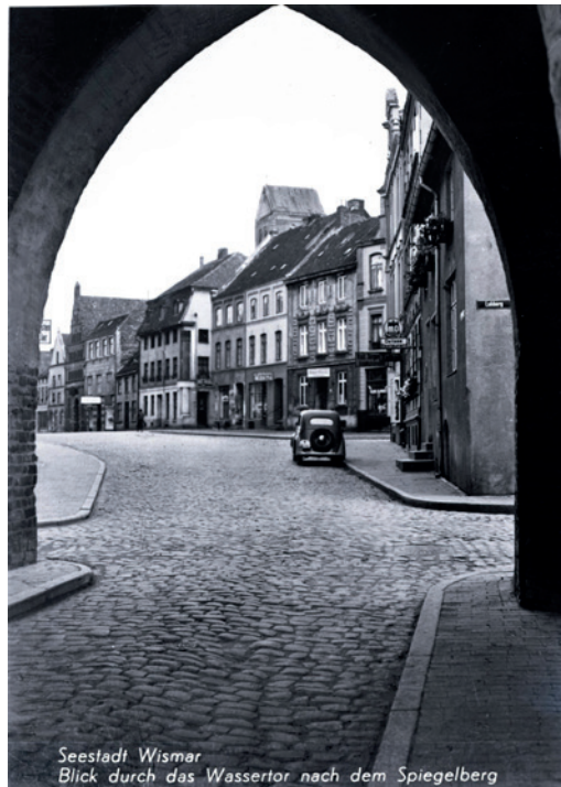
Fotosammlung O_35_005 - Spiegelberg

Schon 1250 trug diese Straße ihren Namen (mons speculi). Sie gehört zu Wismars ersten Siedlungsgebieten und ist durch die Hafennähe dafür prädestiniert gewesen den Wohlstand des frühen Handels abzubilden. Da bekannt ist, dass der Wismarer Hafen schon vor 1209 bestanden hat und die Erlaubnis zum Halten von Handelskoggen urkundlich belegt ist, ist es möglich, dass die Straßenbezeichnung tatsächlich vom mittelalterlichen Luxusgut des Spiegels herrührt, vielleicht durch einen sehr wohlhabenden Anwohner oder Händler.