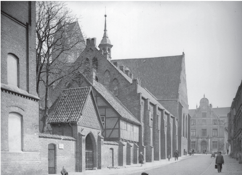
Fotosammlung A.10 Heilig-Geist-Kirche 0447 - Neustadt, © Archiv der Hansestadt Wismar

Schon 1238, neun Jahre nach der ersten Erwähnung, wurde die Stadt in westlicher Richtung erweitert und bekam die damals übliche Bezeichnung „Neustadt“ (nova civitas) als Abgrenzung zur Altstadt. Beginnend etwa 1330 verlagerte sich der Name „Neustadt“ vom Stadtteil auf die Straße und setzte sich durch. 1393 wurde der „Heilig-Geist-Hof“ erstmals supra nova civitas (=oberhalb der Neustadt) genannt.