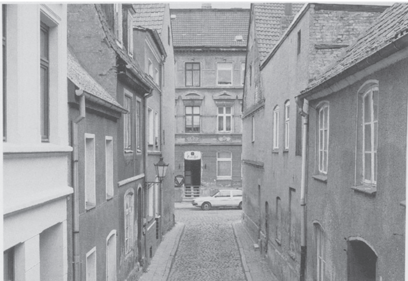
Blick in Richtung Spiegelberg

Die Familie Blücher, die vor 1429 in St. Nicolai über eine Kapelle verfügte, bescherte dieser Straße den Namen Blücherstraße. Hieraus scheint sich im Volksmund die Spottform Blüffelstraße entwickelt zu haben, die sich über mehrere Jahrhunderte hielt und schlussendlich durchsetzen konnte.