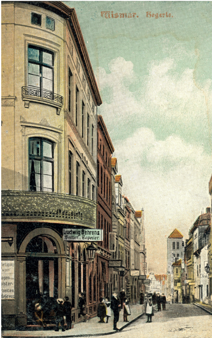
Ansichtskartensammlung 09 PK 1146 - Hegede