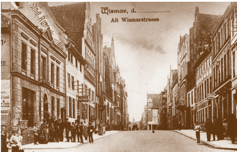
Fotosammlung F 05-0273 - Altwismarstraße, © Archiv der Hansestadt Wismar

Der Bereich „Hinter dem Rathaus“ ist ebenso wie die Hegede erst Anfang des 14. Jahrhunderts vom Marktplatz abgeteilt worden. Bis dahin erstreckte sich der Marktplatz auch noch hinter dem Rathaus. Die beiden Torstraßen Altwismarstraße und die Lübsche Straße boten also einen direkten Zugang zum Marktplatz.