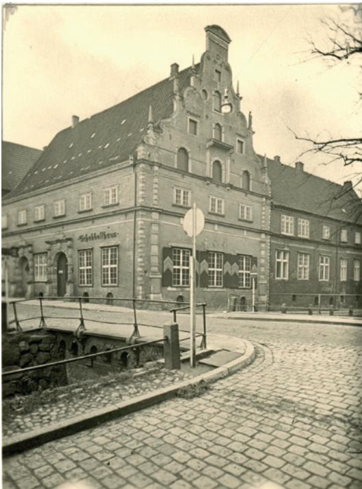
Fotosammlung F 07-0865 - Schweinsbrücke, © Archiv der Hansestadt Wismar

Die Lage eines Schweinekrugs vor dem Poeler Tor und ein vor dem Ratsgericht im Jahre 1730 verhandelter Prozess zwischen den Einwohnern des St. Nikolai Kirchspiels und dem „Schweinekrüger“ Jacob Schröder, legen nahe, dass die Schweinsbrücke ihren Namen tatsächlich von den darüber zur Weidefläche außerhalb der Stadtmauern getriebenen Tieren erhielt.