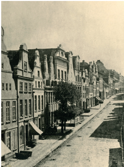
Fotosammlung F 05-1872 - Krämerstraße

Schon um 1260 trug die Straße die Bezeichnung „Platz der Händler“ (pl. institorum), was sich bis heute in leicht verschiedenen Schreibweisen bewahrt hat. Die Krämer sind Kleinhändler gewesen, die vor allem mit „Kram“ handelten, also eher weniger spezifischen Gegenständen wie Tuchstoffe, Gewürzen, Eisenwaren und anderen Kleinwaren. Sie waren nicht mit den Kaufleuten zu verwechseln, die den Fernhandel mit großen Mengen zu verantworten hatten. Rudolph Karstadt eröffnete hier 1881 sein erstes Geschäft und schuf damit den Prototyp für große Kaufhausketten als auch für feste Preise und sofortige Bezahlung mit Bargeld.