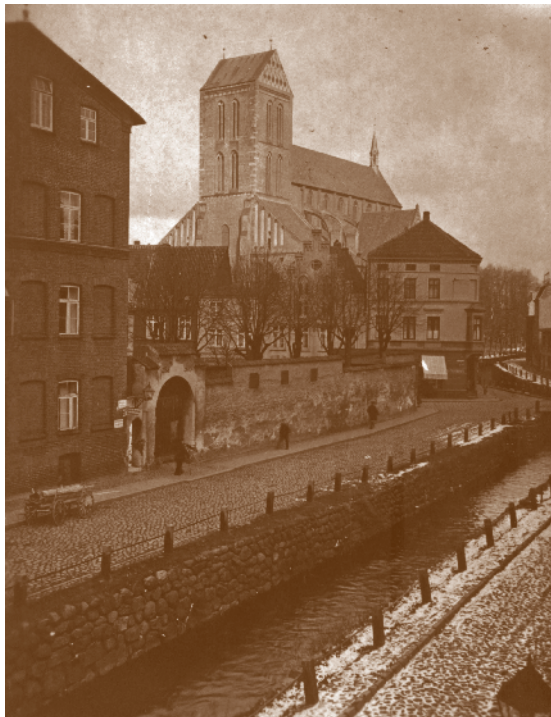
Fotosammlung A.09 0439 - Frische Grube, © Archiv der Hansestadt Wismar

Die Grube ist ein schon seit 1255 nachweisbarer künstlich angelegter Wasserlauf, der die Stadt mit Süßwasser versorgte. Der obere Teil, nachdem der Mühlenbach die alte Mühle passiert, nennt sich Mühlengrube, der lange Mittelteil trägt den Namen Frische Grube und der untere Teil beim Gewölbe heißt Runde Grube. Im Bereich der Frischen Grube konnten die Bürger „frisches“ Wasser beziehen, ihre Wäsche waschen, ihr Vieh tränken und Wasser für das Bierbrauen entnehmen.