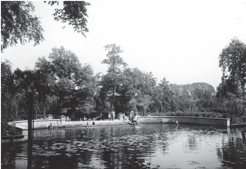
Fotosammlung B.28 FSB 2019 - Lindengarten

Der Lindengarten ist weniger aufgrund seines Namens als wegen seiner Entstehungsgeschichte interessant. Auf dem Gebiet der ehemaligen Bastion Vespasianus, die wie die restliche Festungsanlage ab 1718 geschleift wurde, erbauten sich die Bürger der Stadt 1815 eine „Park- und Flanieranlage“, hauptsächlich durch Geld- und Sachspenden und durch freiwillige Arbeit realisiert. Am Wasserverlauf des Mühlenteichs kann immer noch der Verlauf der alten Festungsanlage erkannt werden.