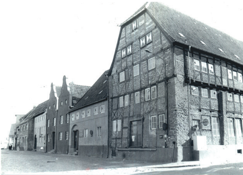
Fotosammlung L 3548 - Am Lohberg

Seit 1437 ist der Name Lohberg für diesen Ort nachweisbar, jedoch ist die Herkunft des Namens bislang nicht abschließend geklärt. Da es jedoch keine Überlieferung dafür gibt, dass hier je Gerberlohe gelagert wurde, ist die Namensherkunft wahrscheinlich im mittelniederdeutschen „lo“ (=niedriges Holz, Gebüsch, Wäldchen, Hain) zu vermuten. Dass sich ebenfalls im 15. Jahrhundert die Bezeichnung „Heide“ für diesen Ort nachweisen lässt, spricht ebenfalls für diese Deutung.