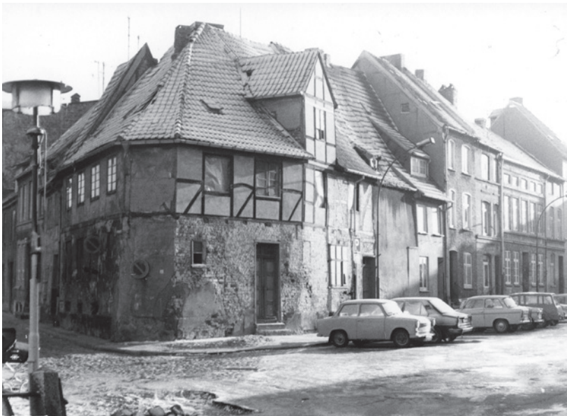
Fotosammlung F05-1763 - Ziegenmarkt

Die Bezeichnung „Ziegenmarkt“ ist erst seit etwa 1750 belegt. Ältere Bezeichnungen waren „Bei der Radolfs-Brücke“, „Bei der breiten Brücke“, „Bei der Steinbrücke“, „Beim Pipensodt“ – es führten hölzerne Rohrleitungen (=pipen) in einen Brunnen (=sodt) – und „bei der Ankerschmiede“. Die Funktion als Viehmarkt ist nicht nachgewiesen und spielte, wenn überhaupt, nur eine untergeordnete Rolle. Im Fokus stand die Brücke als Verbindung zum Hafen.