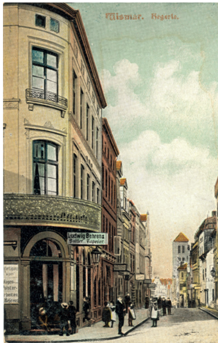
Ansichtskartensammlung 09 PK 1146 - Hegede

Anfang des 14. Jahrhunderts ließ der Rat Marktbuden an der westlichen Seite des Marktes errichten, welche die Vorläufer der festen Häuser waren, und vermietete sie an Händler. Hinter diesen Buden entstand dadurch ein eingegrenzter, nun vom Marktplatz abgetrennter Bereich, der 1325 schon als hega bezeichnet wurde. Warum sich Hegede statt Hege durchgesetzt hat, ist nicht geklärt.