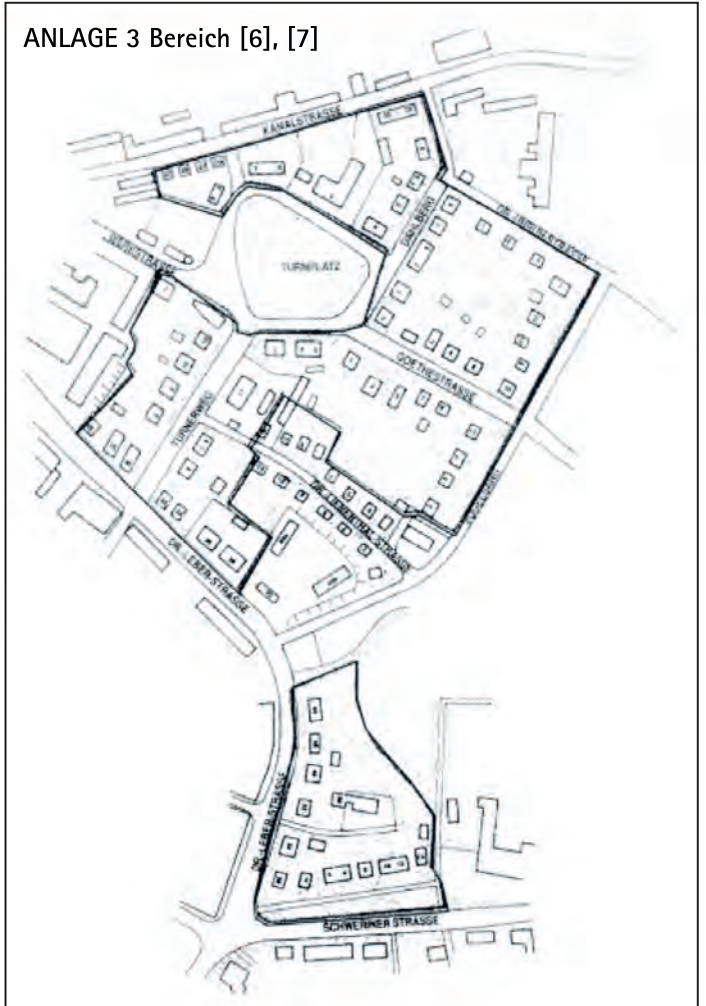
ANLAGE 3 Bereich [6], [7]