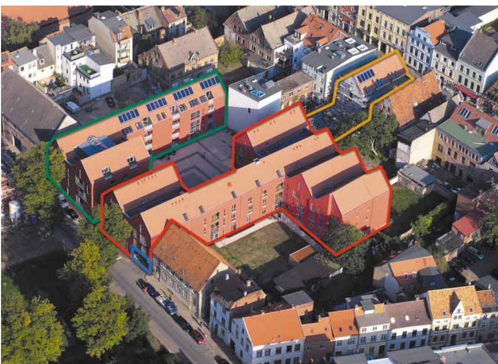
Neue Bebauung, Fertigstellung 2006

Im Zentrum des Blockes ist nunmehr ein attraktiver Standort mit einer Mischung von unterschiedlichen Wohnformen,