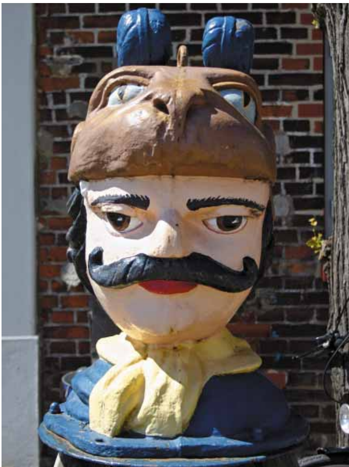
Der Schwedenkopf vor dem Baumhaus