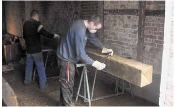
Mechanische Behandlung historischer Kellerdeckenbalken

Projekte mit sichtbaren und dauerhaften Erfolgen, wie die Sanierung des Hauses in dem der Projektträger anschließend ansässig wird, wirkten sich positiv auf die Motivation der Teilnehmer aus. Der Träger des FSTJ, die Internationalen Jugendgemeinschaftsdienste Landesverein Mecklenburg-