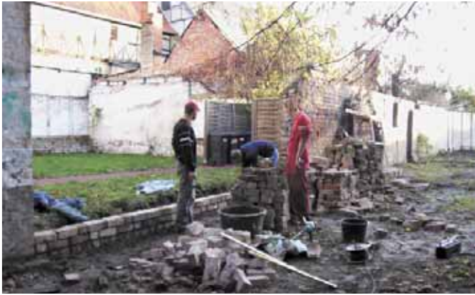
Wiederherstellung der historischen Grundstücksmauern

Kaum einem Bürger und Besucher der Hansestadt Wismar dürfte die Baustelle Hinter dem Chor 13/15 in der Altstadt von Wismar entgangen sein.