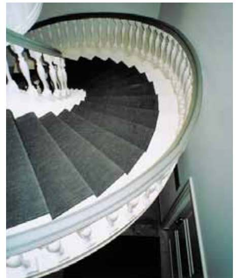
Aufwändige Treppe, 2. H. 19. Jh.