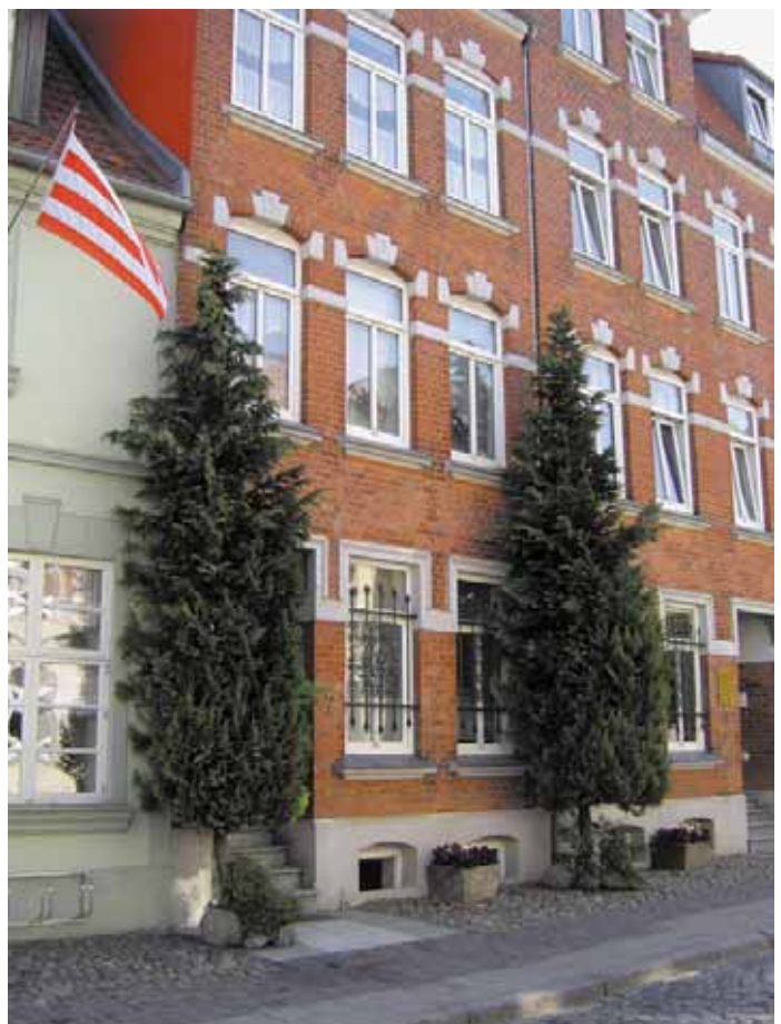
... gut gemeint, aber unpassend im öffentlichen Straßenraum