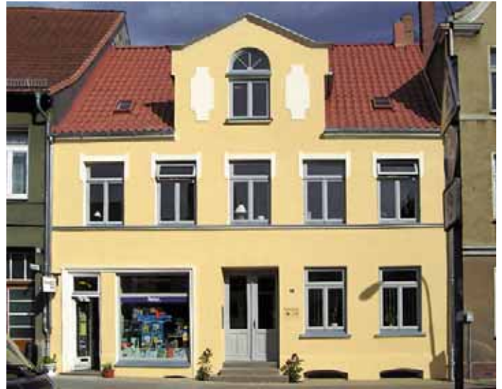
Ansicht Straßenfassade nach der Sanierung