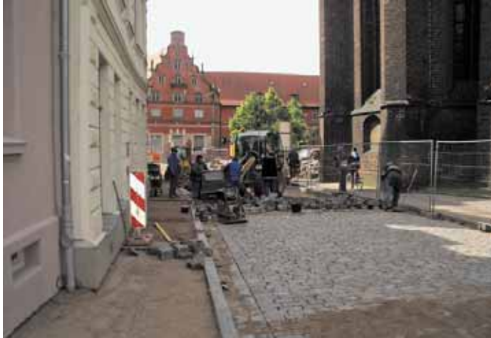
Hinter dem Chor

Mit der Sanierung der Straße Hinter dem Chor und Hundestraße ist ein weiterer städtebaulich wichtiger Teil im Sanierungsschwerpunkt der Nördlichen Altstadt erneuert worden. Damit erhöht sich die Attraktivität dieser doch so wichtigen Straßen- und Fußwege in Richtung Poeler Tor und Bahnhof.