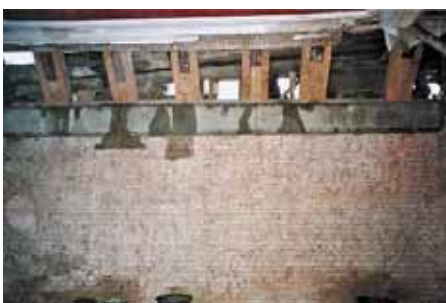
Festsaal im 1. Obergeschoss, Reparatur der Sparrenfüße