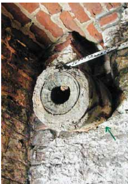
So genannte Pipe

Eines der wohl auffälligsten Gebäude im westlichen Drittel der Lübschen Straße ist das denkmalgeschützte Haus Nr. 50. Direkt an der Ecke zur Großen Hohen Straße gelegen, bildet das breit gelagerte, zweigeschossige Gebäude von sieben Achsen mit der Akzentuierung durch die leicht vorgezogenen drei Mittelachsen und dem zusätzlichen Halbgewölbgeschoss, der niedrigen Attika und dem Dreiecksgiebel mit Lünettenfenster ein städtebauliches Gegengewicht zur schräg gegenüber liegenden Kirche und zum Langhaus des Heiligen-Geist-Spitals.