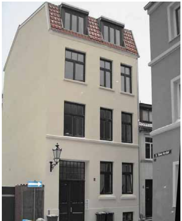
Straßenfassade nach der Sanierung