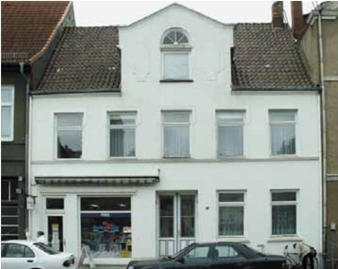
Ansicht Straßenfassade vor der Sanierung

genutzt werden. Die Eigentümer haben das Grundstück erworben, um in der Altstadt eigen genutzten Wohnraum zu schaffen. Gleichzeitig wurden im Erdgeschoss rechts die Räumlichkeiten für eine selbst genutzte Büroeinheit ausgebaut. Für die Instandsetzung des Daches und Neugestaltung der Fassade wurden Städtebaufördermittel zur Verfügung gestellt.