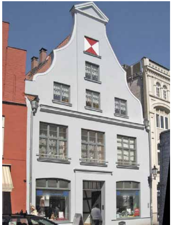
Ansicht Straßenfassade nach der Sanierung

Im 19. und 20. Jhd. erfolgten insbesondere im Inneren des Gebäudes diverse Umbauten. Im Zusammenhang mit der Sprengung des Kirchenschiffs von St. Marien muss der ursprüngliche Hofgiebel in Mitleidenschaft gezogen worden sein, denn der Hofgiebel wurde im Zeitraum von 1963 bis 1965 neu aufgemauert. Im Zuge der Sanierung entstanden eine Gewerbeeinheit und zwei Wohnungen.