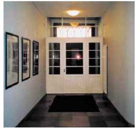
Windfang im Erdgeschoss, A. 20. Jh.