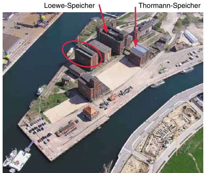
„Kruse-Speicher“ Silo 2

Nachdem jahrzehntelang der Thormann-Speicher in der Etagenstruktur eines Bodenspeichers die Silhouette des Alten Hafens bestimmte, war die Errichtung des Kruse-Speichers der dritte Lagerbau in der Silostruktur innerhalb weniger Jahre. Zuvor waren schon der Löwe-Speicher (Silo 1) und der Ohlerich-Speicher (Silo 3) seit dem Jahr 1935 errichtet worden.