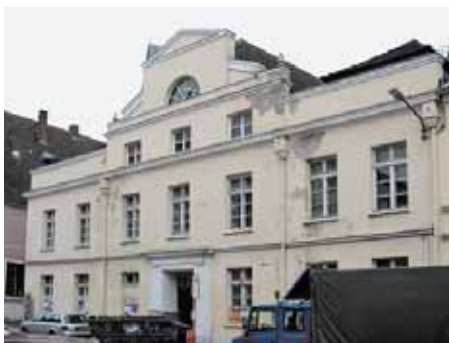
Straßenfassade vor der Sanierung