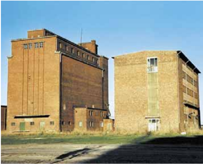
Süd-West- und Süd-Ost-Fassade mit Sozialgebäude

Nachdem wir 2004 den „Thormann-Speicher“ und 2005 den „Löwe-Speicher“ (Silo 1) vorgestellt haben, setzen wir diese Reihe in diesem Jahr mit dem „Kruse-Speicher“ (Silo 2) fort.