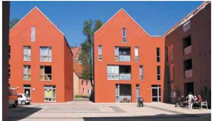
Blick in den Innenhof

wartstraße 31 und das dahinter befindliche Verwaltungsgebäude, das Speichergebäude (ehem. Hof der Antoniter) und die Hülle des ehemaligen Werkstattgebäudes in der Papenstraße zu sanieren und ebenfalls einer neuen Nutzung zuzuführen.