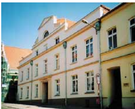
Straßenfassade nach der Sanierung