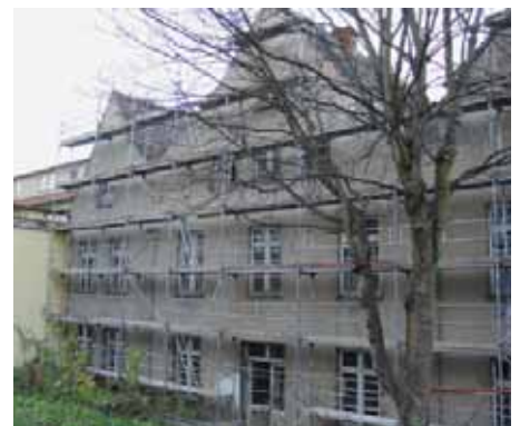
Rückfassade vor der Sanierung