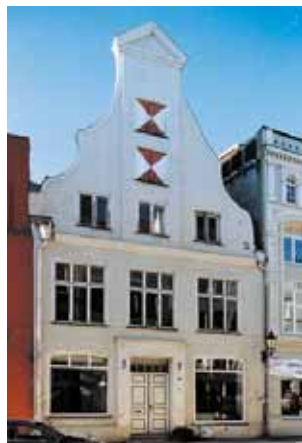
Ansicht Straßenfassade vor der Sanierung

Die Dankwartstraße 5, mit einem zweigeschossigen Giebelhaus von drei Achsen bebaut, ist ein Einzeldenkmal. Es ist ein Gebäude von beachtlichen Ausmaßen mit besonders wertvollen, historischen Bauteilen der unterschiedlichsten Epochen. Aufgrund der Bedeutung des Gebäudes mit mittelalterlichem Kernbau waren zur Vorbereitung einer Sanierung umfassende Voruntersuchungen unter Begleitung der Abteilung Denkmalpflege erforderlich. So konnten im Rahmen restauratorischer Untersuchungen mittelalterliche Brandwände datiert werden. Dendrochronologische Untersuchungen haben ergeben, dass die Holzkonstruktion des Dachstuhl und der Decke über dem Obergeschoss, bestehend aus Eichenholz, in das Jahr 1668 datiert werden kann.