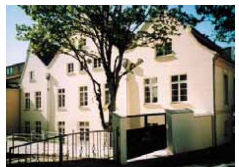
Rückfassade nach der Sanierung